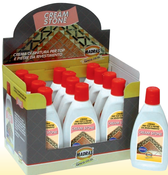
Espositore da banco